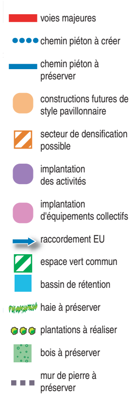
Schéma de principe d'aménagement de la zone de Pont-Digo sud